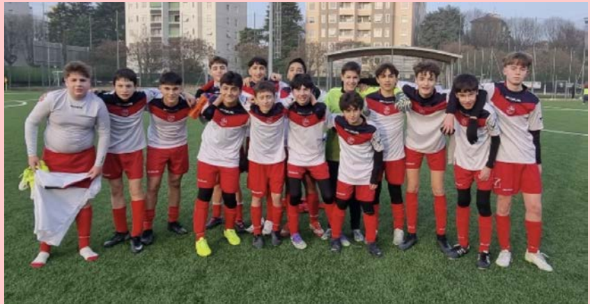
Under 15 – ultima vittoria casalinga con il Virtus Sedriano!!