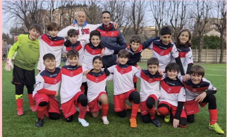
La squadra Under 12 in occasione dell'ultima giornata di campionato e festeggiamenti per la coppa PLUS!

Prima di tuffarci nei risultati, vogliamo ricordare insieme la bellissima festa di Natale Oransport che ha chiuso il 2025. Tutti i nostri piccoli atleti si sono riuniti con le loro famiglie per festeggiare insieme: giochi, sorrisi, panettone e la presenza di tutti i mister che hanno reso speciale quel momento. Grazie a tutti coloro che hanno partecipato e reso magica quella giornata!