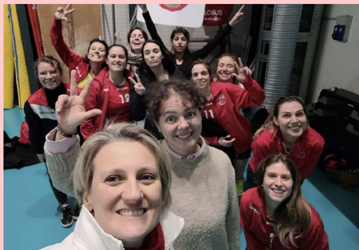
Volley/G – Vittoria contro il S. Giovanni XXIII Bussero!!

Le ragazze del volley sono tornate in campo dopo la Festa di Natale Oransport con una voglia matta di far girare la palla. Il clima festivo ha cementato il gruppo, e i risultati di gennaio mostrano una squadra che non abbassa mai la guardia.