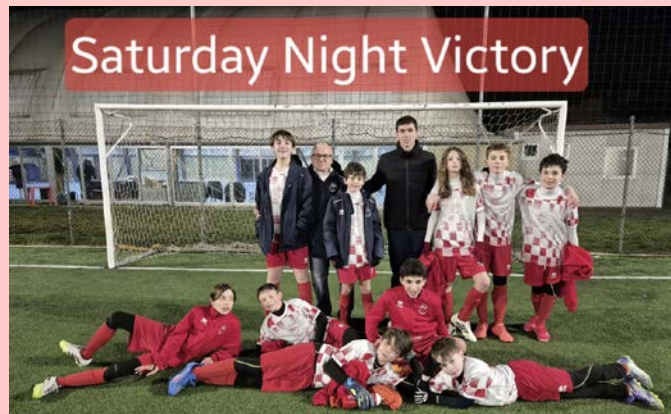
Under 13 vittoria in trasferta sul campo del POS Senago